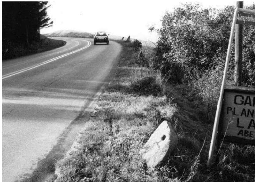
Bundsvej op ad bakken mod vest.

Indtalt på lydmedie 2012 og efterfølgende transskriberet.