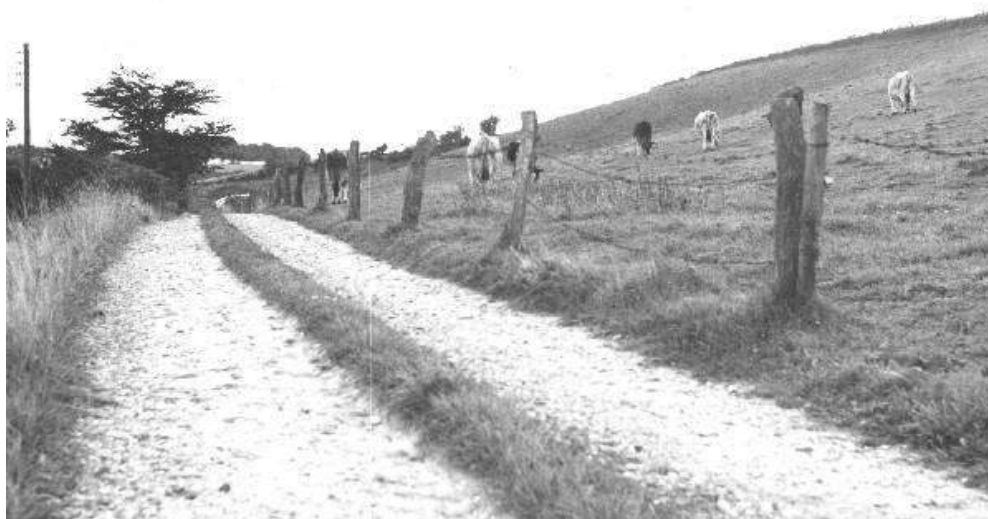
Kristen Smeds Stræde mod SØ.

NB: Teksten i parenteserne er skrevet af redaktøren.