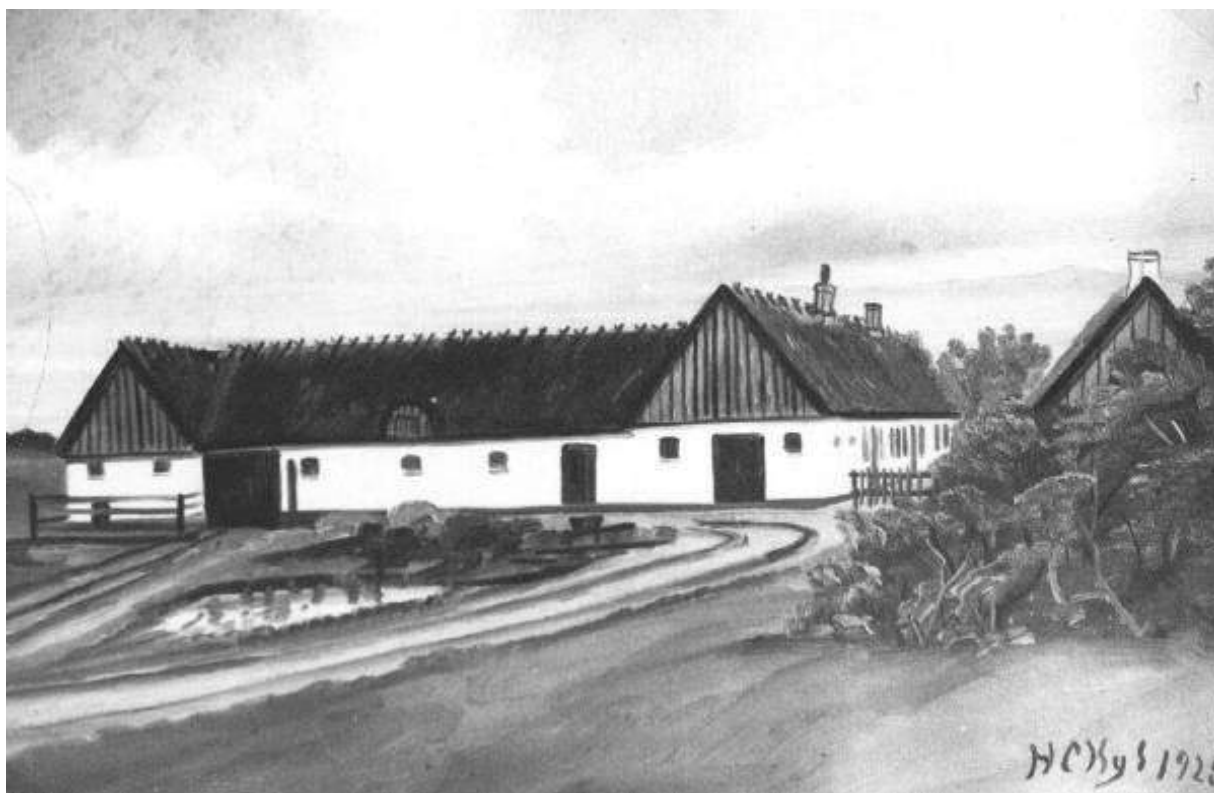
Maleri af Rastadgård 1925.