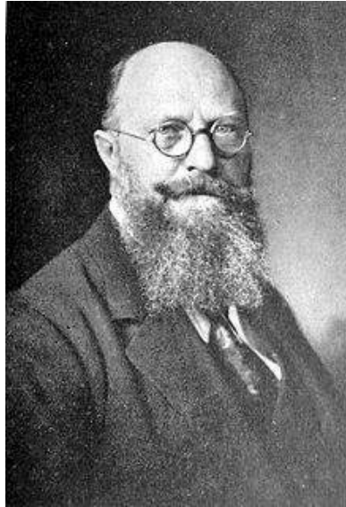
Thorvald Stauning, statsminister.