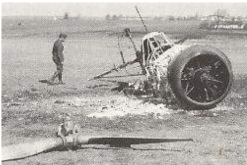
Ødelagte Fokker D.XXI efter angrebet.

9. april 1940 kl. 5:45 blev Værløselejren, der på det tidspunkt husede Københavns luftforsvar, angrebet af 9 tyske Messerschmitt Bf 110 langdistancejagere med brandammunition. I løbet af ca. tre kvarter og fem angrebsbølger blev mere end 90 % af lejrens 24 fly, her i blandt de 12 næsten nye Fokker XXI, der stod klar til afgang, ødelagt. Et dansk rekognosceringsfly der netop var på vej i luften blev skudt ned.. Under besættelsen overtog det tyske Luftwaffe lejren.