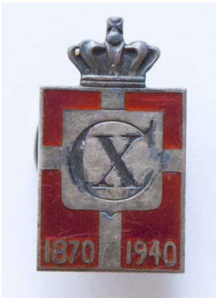
Konge emblem 1940.

Emblemet var planlagt til markering af kongens 70 års fødselsdag. Den fik efter d. 9. april en særlig plads for mange danskere, der var stolte af at bære emblemet på jakke reversen.