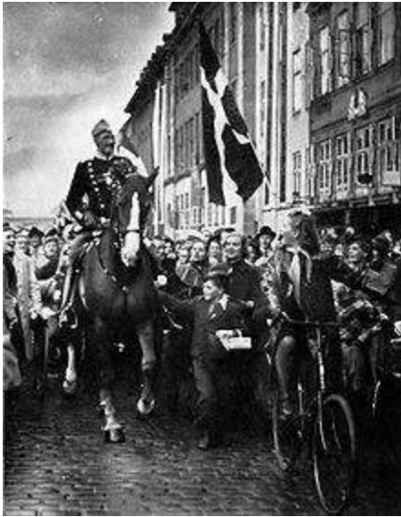
Kong Chr. X., 1940