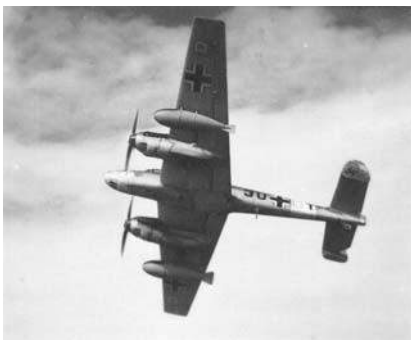
Messerschmitt Bf 110, langdistancejager.