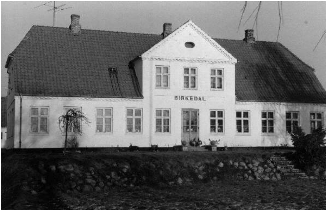
Birkedal ved Slagslunde.