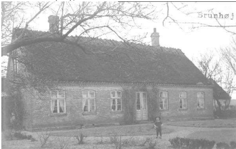
Brunhøj ca. 1915.

Interviewer: Bent Stiesdal (BS), den 10 -2-1995