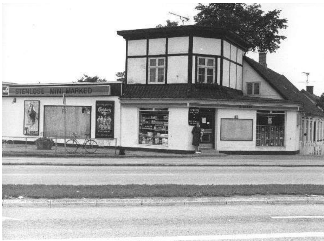
Købmandsforretning på hjørnet af Frederikssundsvej og Byvej i Stenløse.