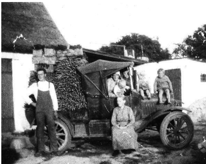
Ford T (fra ca. 1919), pakket til Grønttorvet, på Egedalsvej 13, Veksø.