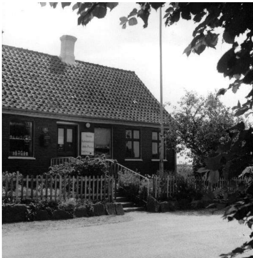
Købmandsforretningen i Stenlille.