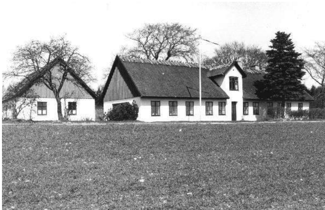
Præsteskovgård i Slagslunde.