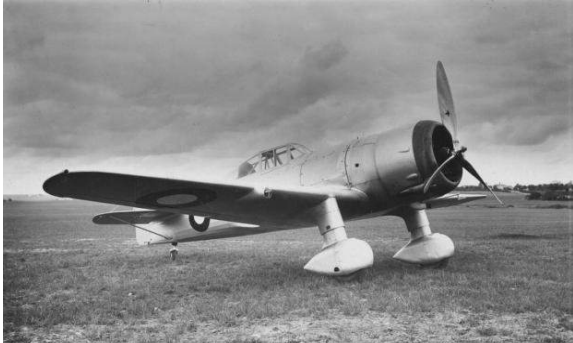
Fokker D. XXI.