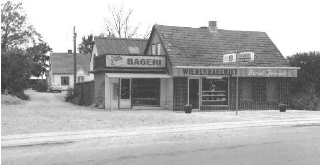
Wienerbageriet i Stenløse 1971.