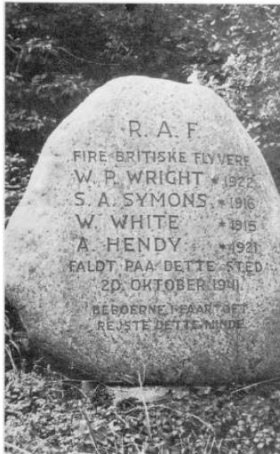
Mindestenen i Fårtoft.