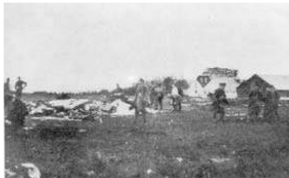
Nedstyrtningssstedet med Kirkegaardens ejendomi baggrunden.