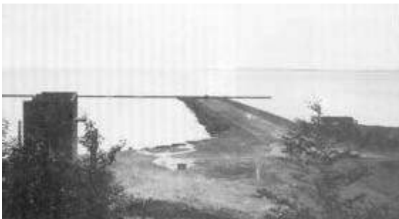
Den tidligere flyvebase i Dragsbæk.

Under den tyske besættelse af Danmark 1940-45 anlagde besættelsesmagten en del nye flyvepladser og udbyggede allerede eksisterende. Den vigtigste var Aalborg lufthavn, der havde stor strategisk betydning i forbindelse med tyske transporter til Norge. Tyske kampfly rettede også herfra angreb på skibe og mål i England.