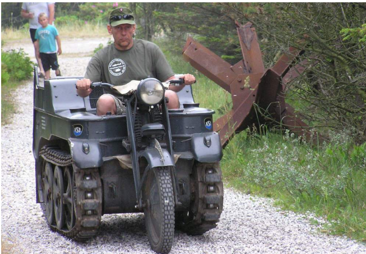
Kettenrat fra Gilleleje

Det er BSTH, som arrangerer træffet, og har du lyst at være med til at få det hele til at køre, så ring eller skriv til Esben Kaagaard - 97 92 68 20 / 40 74 27 20, ek@tp-gruppen.dk .