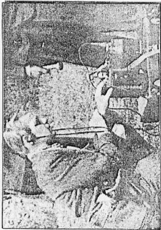
Eureka i funktion på en nedkastningsplads.

Man begyndte at etablere de såkaldte "Eureca"-pejlestationer, som skulle vejlede de allierede piloter frem til nedkastningspladserne. I august blev der således etableret en station på Thyholm og i oktober en på Agerø i Limfjorden. På dette tidspunkt fløj piloterne så vidt muligt efter pejleapparaterne, og fra slutningen af september bestemte man