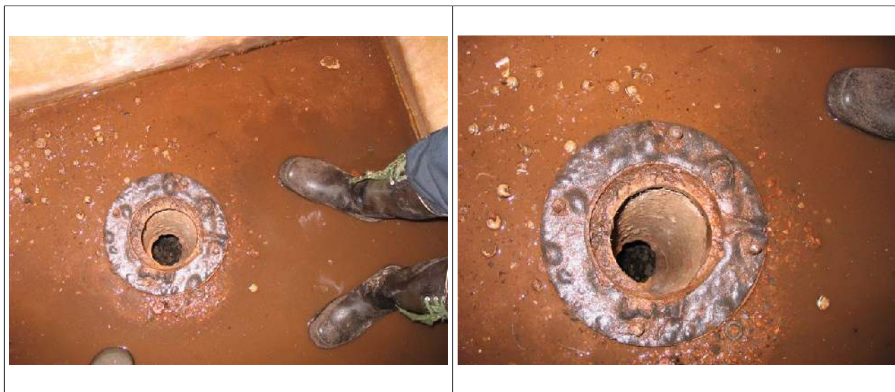
Er dette julemandens skjulested ?